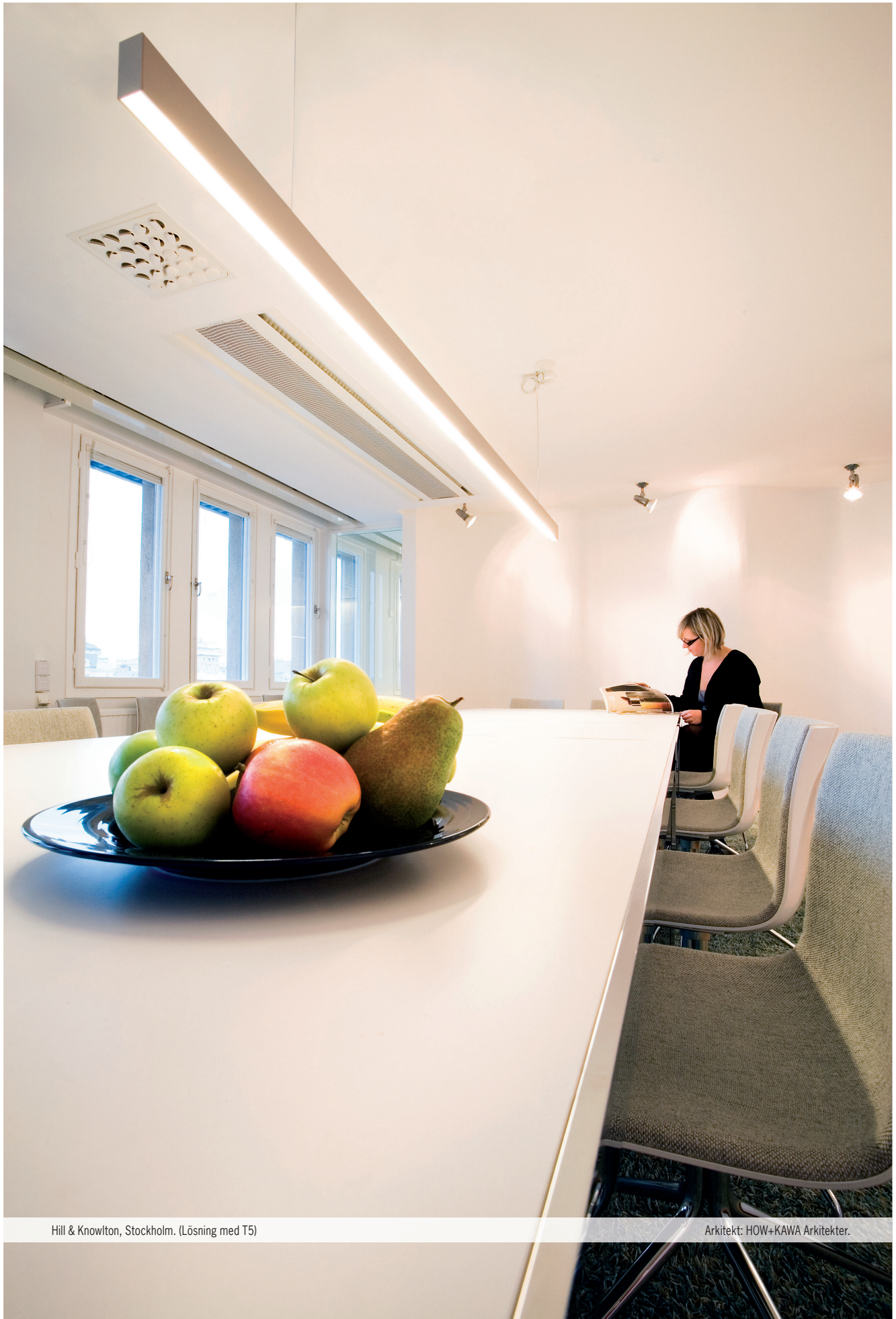
Hill & Knowlton, Stockholm. (Lösning med T5)