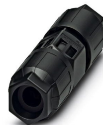
Kabelförbindning 1006869 / 1023535 L 89mm Ø25mm